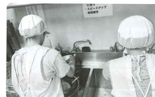
琴弾の丘 厨房作業

軽作業 (除草作業、清掃作業)、 下請け作業 (組立等) がございましたら、 お気軽にご相談ください！