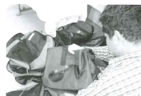
養父市大屋町 オグラ カバン作業