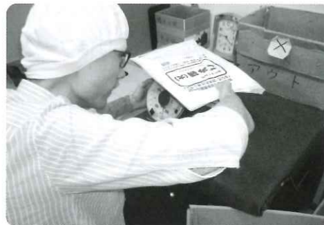
南但指定ごみ袋の生産