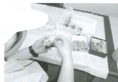
養父市八鹿町 近畿食品 下請け作業