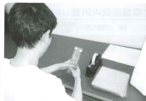
養父市大藪 NEOMAX近畿 ペットスリーブ製作