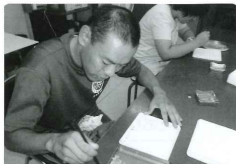
養父市八鹿町 長岡金属工業 下請け作業