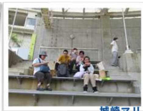
城崎マリワールド