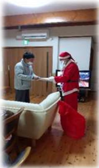
おおや作業所のカレンダー贈呈