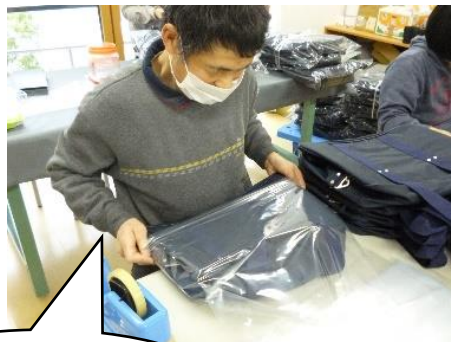
色々なかばんがあ って楽しい