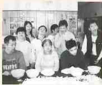
仲良くポリちぎり