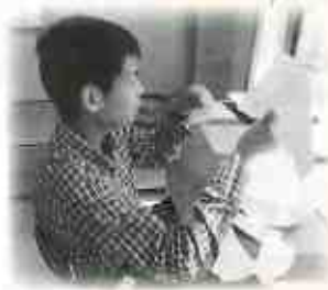
② 紙を細かくちぎります