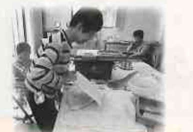
⑥ 板に移し取り出します