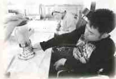
③ ミキサーにかけて液状にします