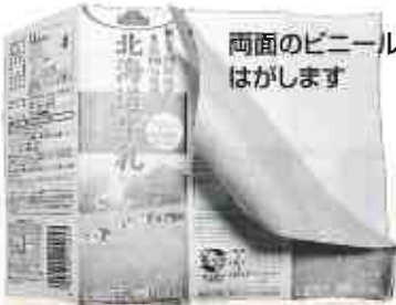
両面のビニールをはがします