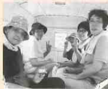
ワクワク、ドキドキ 一円電車の旅