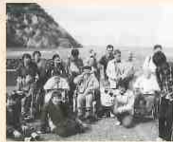
皆でアジ釣り。釣ったぞー!