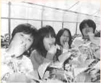
楽しくなっちゃウイチゴ狩り