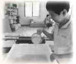
④ ミキサーから移します