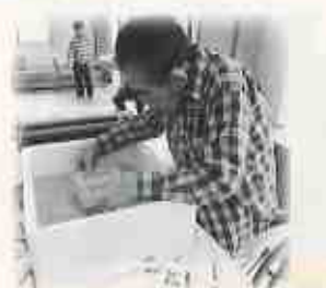
⑤ 枠箱に入れます(紙すき作業)