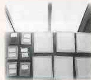
⑧ 自然乾燥させます