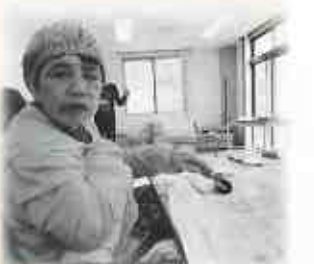
⑦ ローラーをかけて延ばします